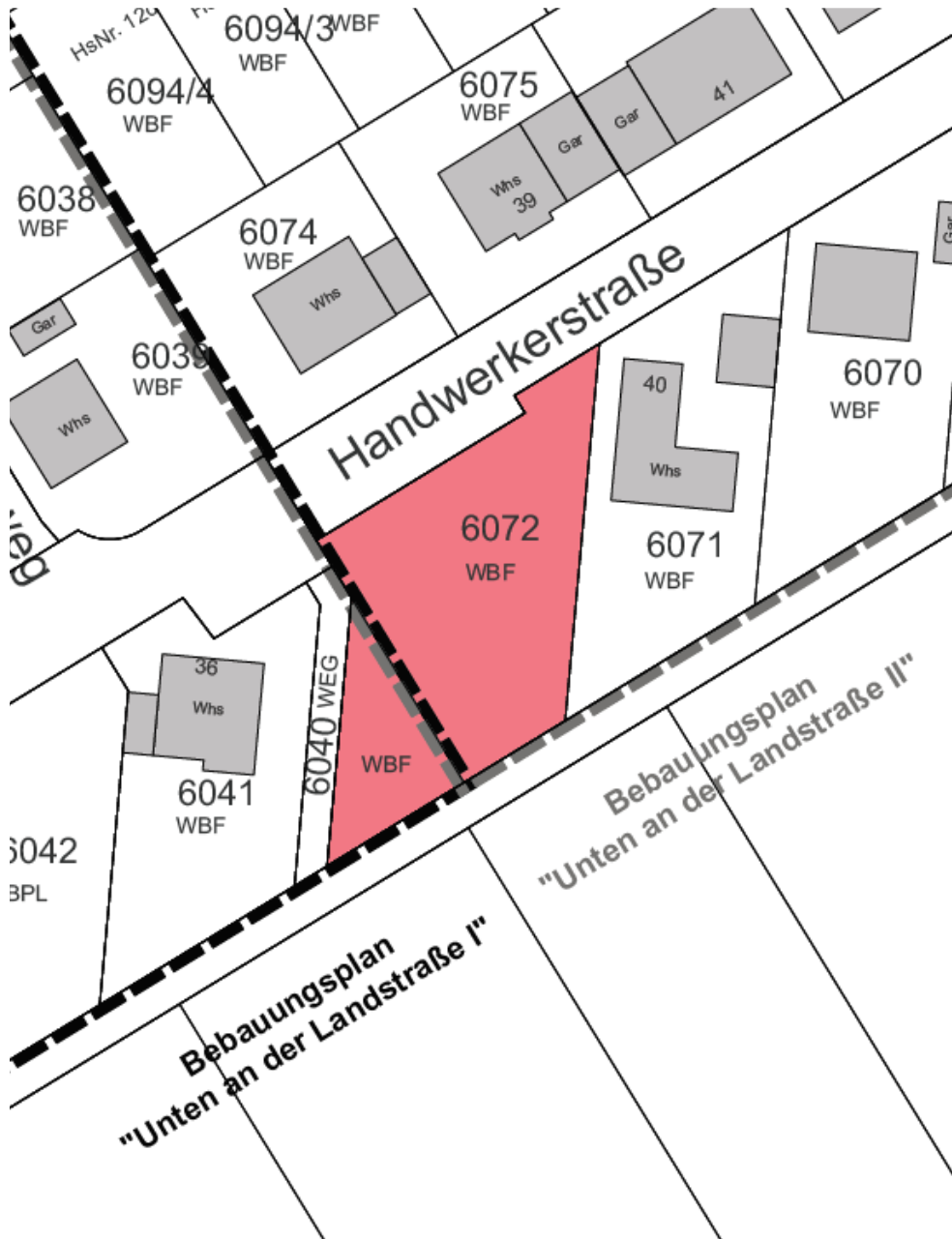
Übersicht Geltungsbereiche „Unten an der Landstraße I“ und „Unten an der Landstraße II“ (ohne Maßstab)