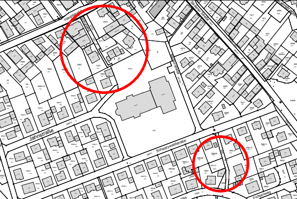
Übersicht: M 1:5000

genauer Verlauf siehe Bebauungsplan "Hinten am Ort und Bruchweg", 2. Änderung und Neufassung