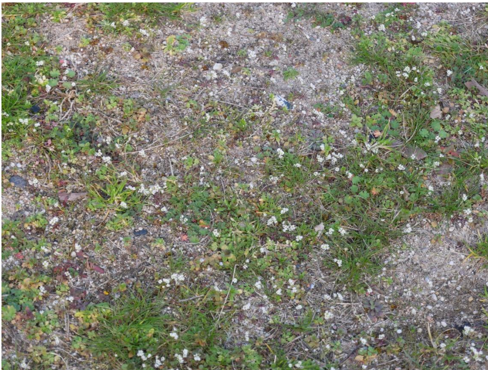
Abb. 3: Spielplatz mit ausgehagertem Zierrasen, hier blühend das Frühlingshungerblümchen