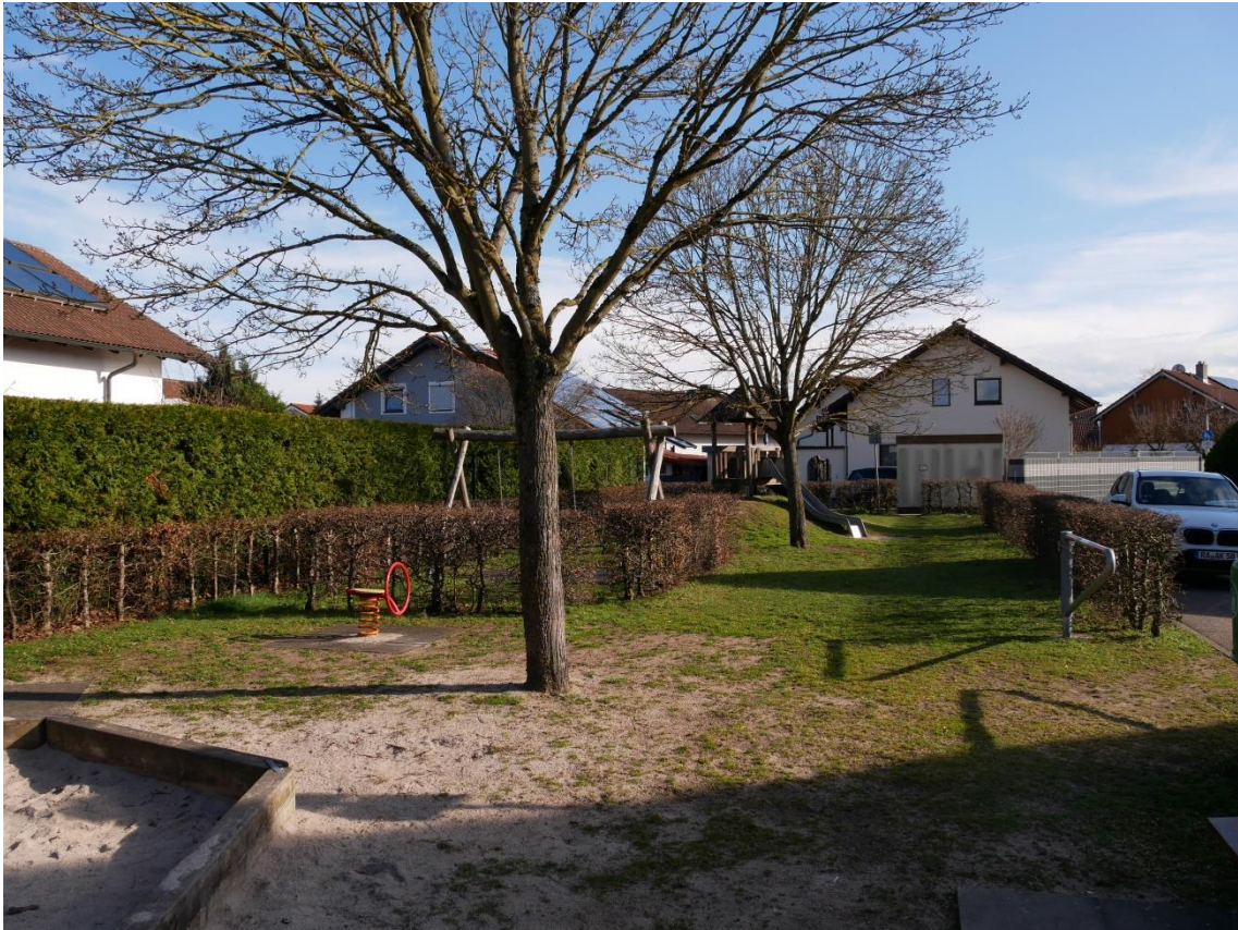
Abb. 5: Spielplatz mit 2 Einzelbäumen (Spitzahorn)