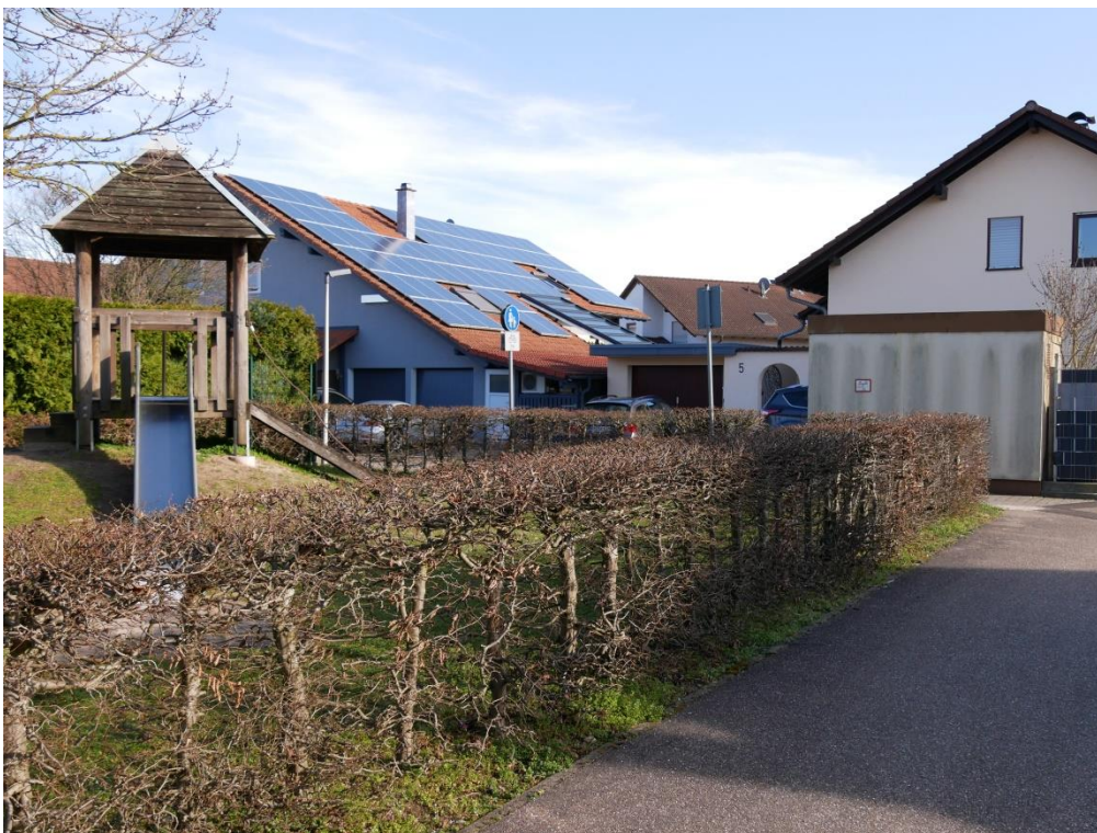
Abb. 4 Spielplatz mit umrahmender Hainbuchenhecke und offenen sandigen Böden