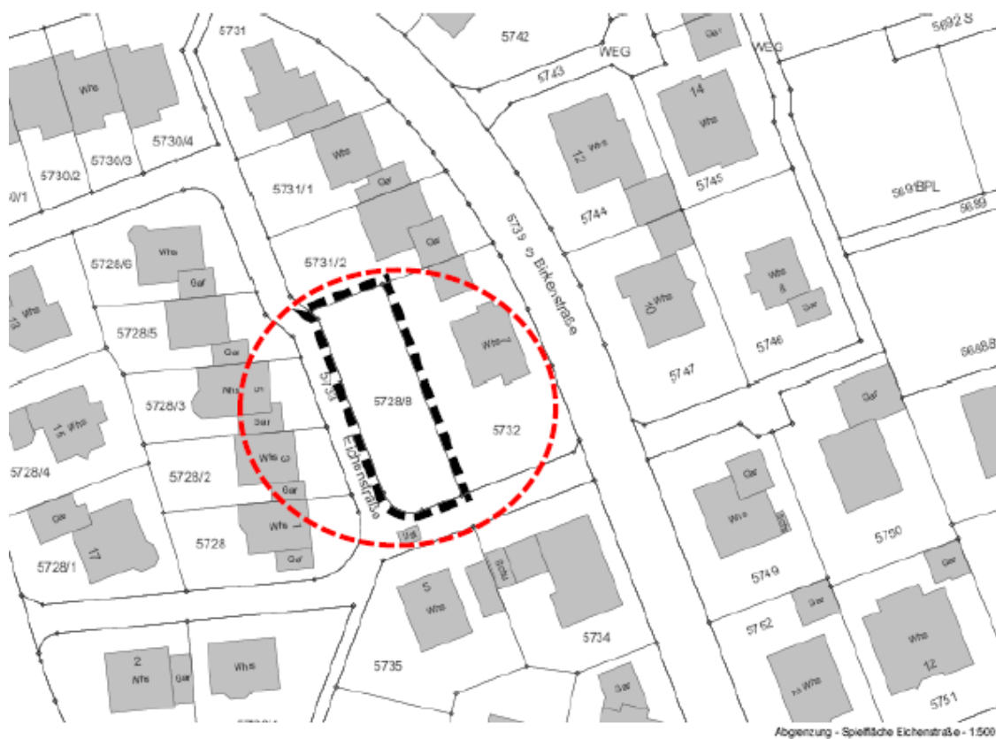
Abb. 1: Lage des Untersuchungsgebietes (UG schwarze Risslinie)