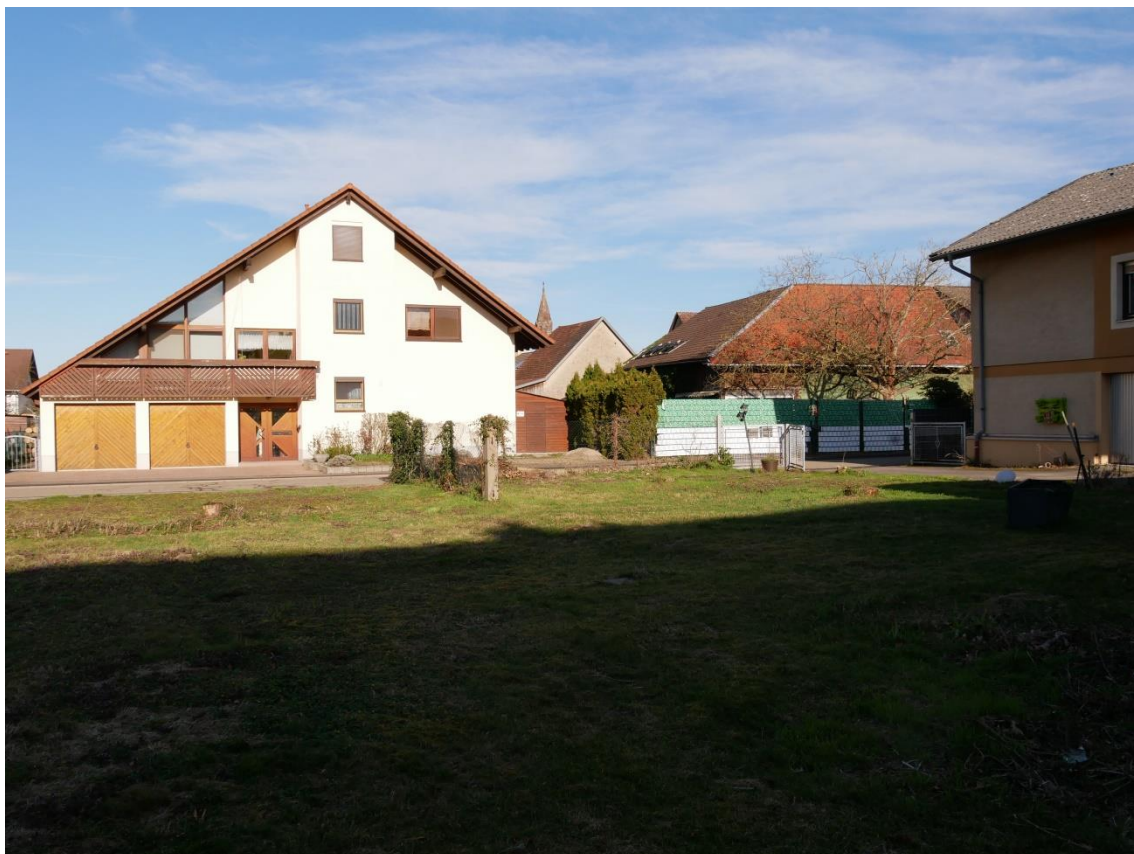
Abb. 3: grasreiche Ruderalflur kurz gemulcht, Strauch und Baum frei