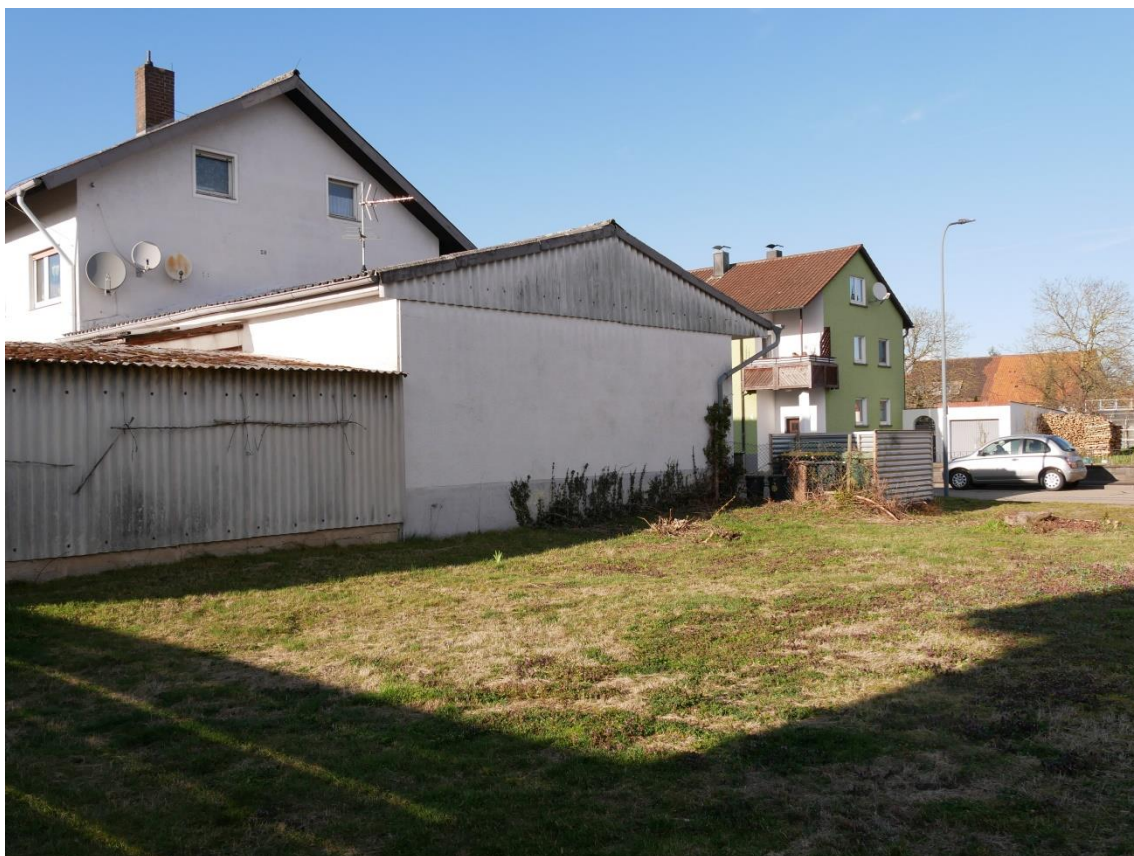
Abb. 4 grasreiche Ruderalflur kurz gemulcht, vereinzelt Störzeiger , ohne Deckung für Reptilien