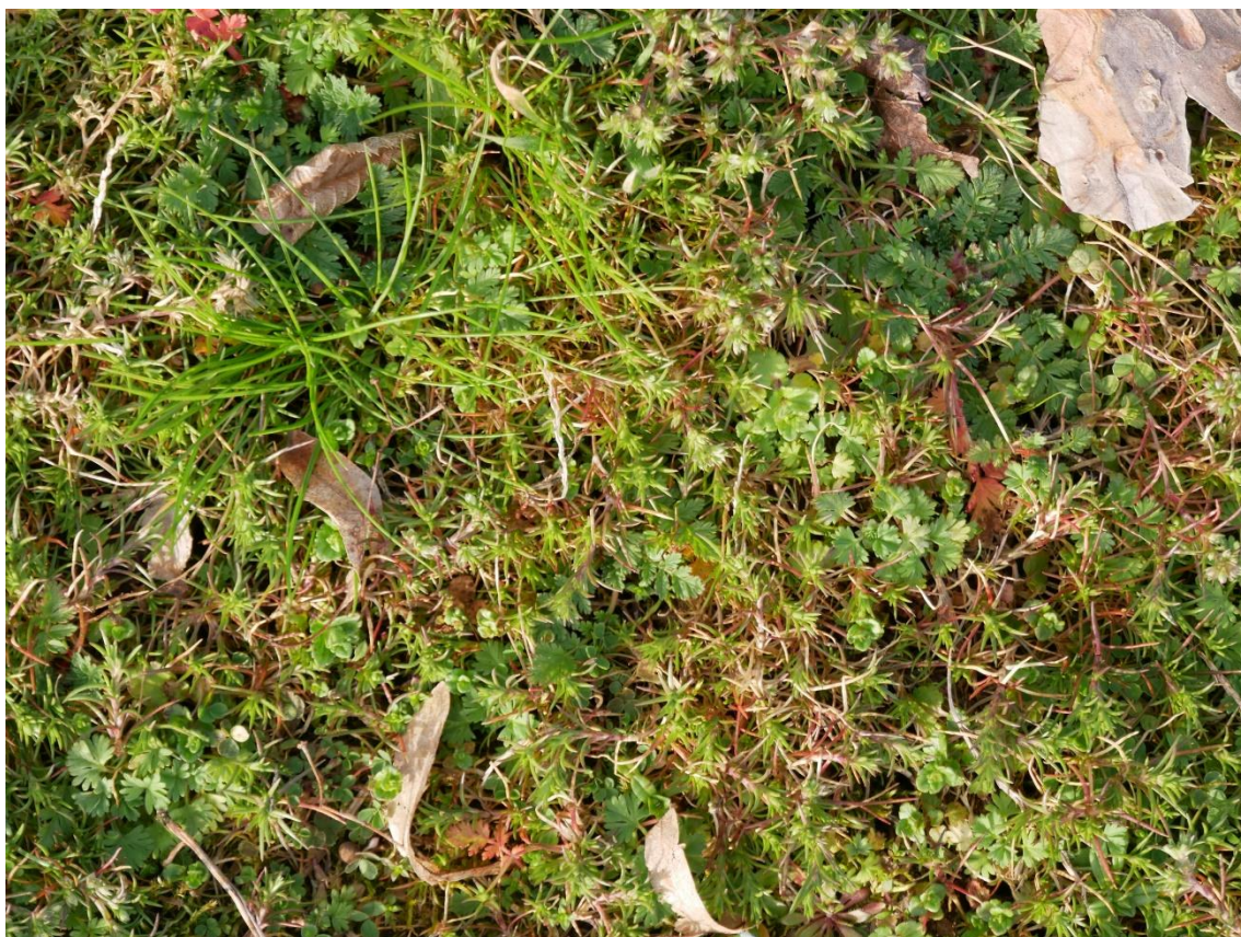
Abb. 4 Spielplatz mit ausgehagertem Zierrasen mit Magerrasen- und Sandrasenarten