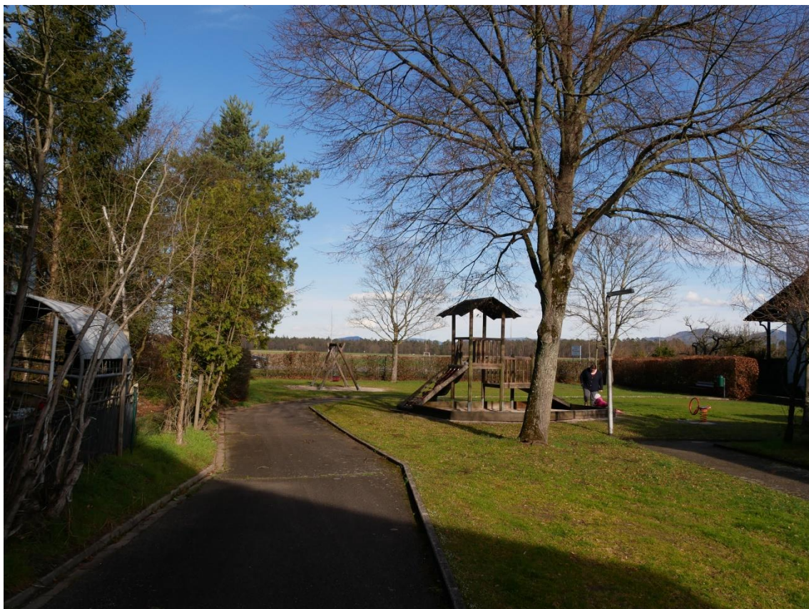
Abb. 3: Spielplatz mit Hainbuchenhecke und ausgehagertem Zierrasen