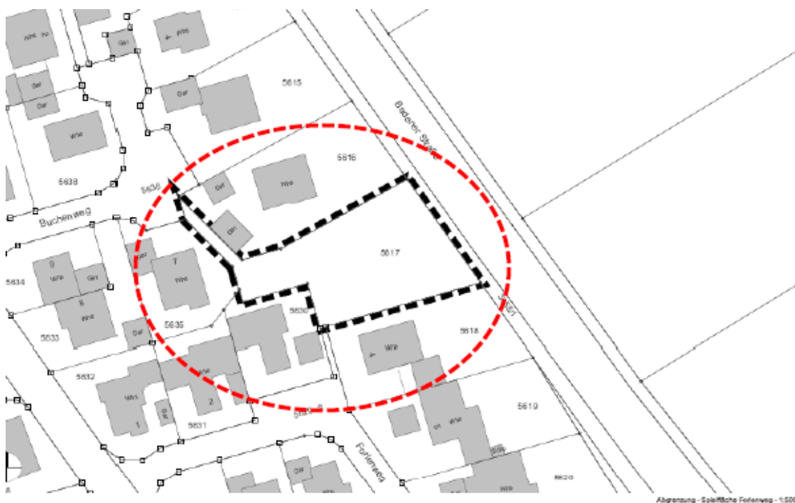
Abb. 1: Lage des Untersuchungsgebietes (UG schwarze Risslinie)