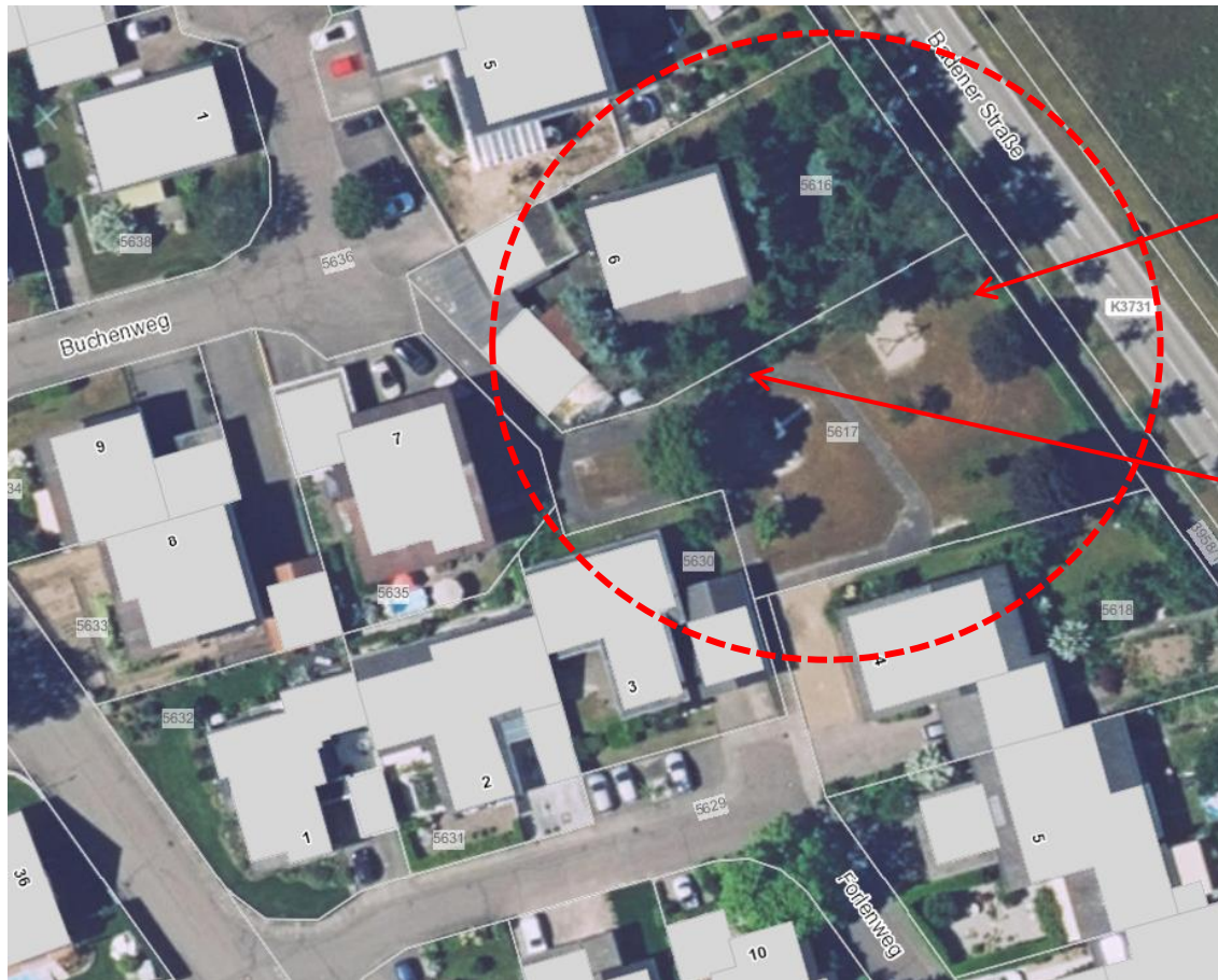
Abb. 2: Lage des Vorhabens (rote Kreise)

Geplant ist die Rodung von 5 Bäumen und das Baufeldfreimachen sowie der Neubau einer Wohnanlage